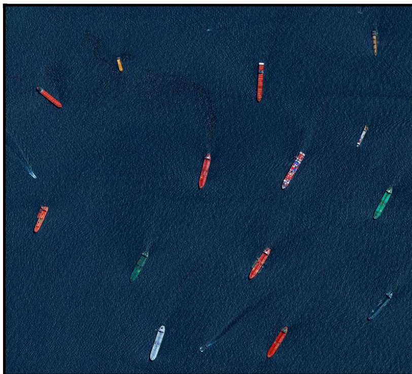
Barcos cargueros esperan para entrar al puerto de Singapur.

De esta manera, la cooperación se constituye como “un mecanismo de acción menos costoso y desgastante respecto a las presiones político-diplomáticas directas y del uso de la fuerza militar” (Prado Lallande; 2008:40) para lograr los objetivos nacionales de un Estado racional y mantener el statu quo. El equilibrio de poder debe ser mantenido por los Estados más poderosos, incluso a través de la cooperación; esta es utilizada para sobornar a los Estados receptores de ayuda (“comprar” las voluntades del Estado-receptor) o generar prestigio, elementos que pueden estar presentes junto con otros de carácter más humanitario.