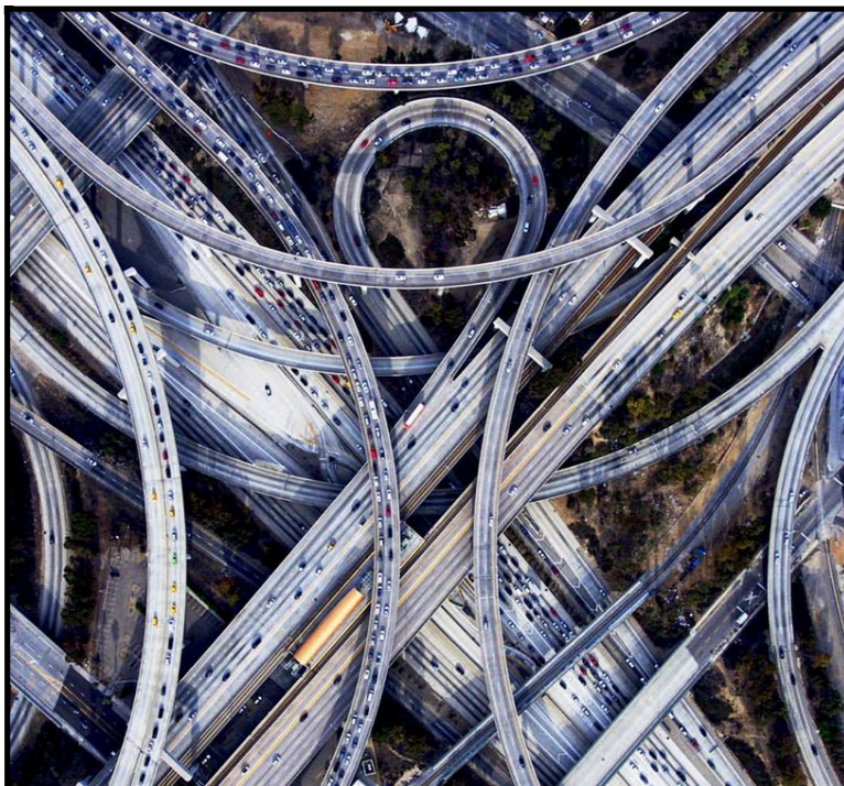
Autopista en Los Angeles. Fuente: Daily Overview .

A raíz de ello, la cooperación y la armonización de intereses se posicionan como una posibilidad concreta: los objetivos de los diferentes actores pueden cambiar de un área temática a otra, de acuerdo a distintas coyunturas y contextos; la cooperación entre los diversos actores se da, desde esta concepción, cuando es escasa o nula la armonía de intereses entendiéndola como una “una situación en la cual las políticas de dos actores (ejecutadas en base, a sus intereses particulares y sin contemplar los efectos sobre otros) automáticamente facilitan el alcance de los objetivos de los demás” (Keohane, 1984:51 citado en Tokatlian y Pardo, 1990: 354).